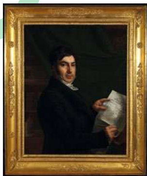
Portrait de Jean-François Champollion

La maison des frères Jacques-Joseph et Jean-François Champollion à Vif devenue « musée Champollion » fera voyager les visiteurs jusqu'aux rives du Nil.