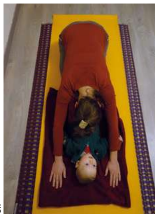
Des séances de yoga avec bébé

www.randonnee-yoga-nature-interieure.fr - Nature Intérieure est proposée dans la Happy Baby Box. Les séances de yoga maternité ne se substituent en aucun cas au travail des sages-femmes.