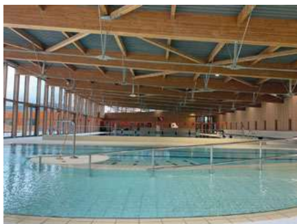
La halle couverte et les deux bassins à l'intérieur

un montant de 9,60 M€ HT piloté par le Sivom du Néron (syndicat intercommunal à vocations multiples du Néron) qui regroupe les communes de Fontanil-Cornillon, Mont-Saint-Martin, Proveyzieux, Quaix-en-Chartreuse, Saint-Égrève et Saint-Martin-