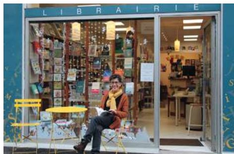
Un grand choix de livre jeunesse, et le sourire en plus

Librairie L'Esprit Vif - 8, rue Champollion - Vif librairie.lespritvif@orange.fr