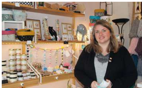
Une boutique dédiée au fait main à Échirolles

https://www.facebook.com/lamaisoncreativedeceline