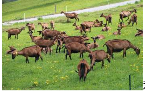
Élevage de chèvres alpines à Méaudre

R etour à la ferme: les familles apprécient « La Clé des Champs », ce rendez-vous annuel où les agriculteurs ouvrent leurs portes aux visiteurs, tout en offrant animations et dégustations. Cette année, La Clé des Champs est annoncée samedi 1 er et dimanche 2 mai 2021, en Isère et aussi en Savoie et Haute-Savoie. Balade nature ou en poneys, contes, animation musicale, atelier à la découverte de la nature, tonte de brebis, labyrinthe géant, dressage de chevaux, fabrication de fromage sont proposés aux visiteurs. D'autres exploitants agricoles échangeront sur des questions d'économies d'énergie et de production d'énergies renouvelables. La diversité des exploitations agricoles ravira les curieux: élevages de bisons, de vaches, de chèvres, de cochons, de volailles ou de brebis ouvrent leurs portes. Apiculteurs, viticulteurs, maraîchers seront aussi à votre écoute, ainsi que parfois des productions plus confidentielles comme la fabrica-