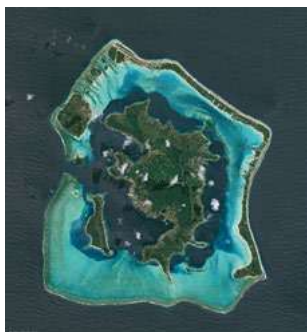
L'île de Bora-Bora vue du ciel

Le musée EDF-Hydrelec à Vaujany espère ouvrir le 17 avril l'exposition « L'eau vue d'en haut », un voyage autour de la planète bleue. Des images satellites des ressources en eau de la planète seront présentées aux visiteurs. Divisée en 4 espaces thématiques, l'exposition aborde les questions de l'eau sous toutes ses formes : océans, eaux continentales, glaces, atmosphère. Des témoignages audio d'un pêcheur du Bangladesh, d'un skippeur ou d'une femme inuit, des photographies, des maquettes accompagneront ces photos afin de souligner la préciosité de la ressource aquatique. Ces observations du ciel permettent aussi d'anticiper les phénomènes climatiques. Voilà comment les vues d'en haut sont utiles aux gens du bas !