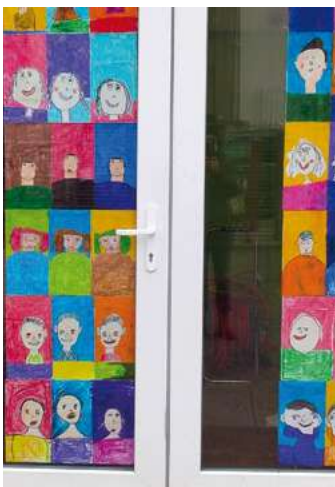
Portraits à la manière d'Andy Warhol

A près le projet Carnet de voyage , l'art est au centre du projet de l'école Kerber, à Grenoble. Les élèves découvrent toutes les semaines