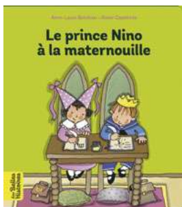
Un des nombreux «Best-off» d'Anne-Laure Bondoux