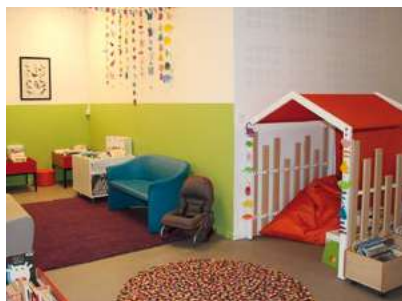
Le coin des très petits lecteurs

Les actions culturelles vont elles aussi reprendre comme des temps de lecture à voix haute un samedi matin par mois à 10h30. Entrez, voyez... et lisez! Les bibliothèques sont ouvertes & gratuites.