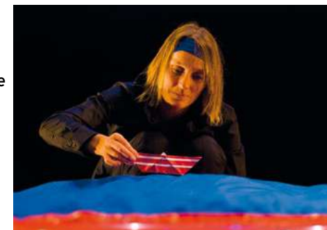
Une piscine en plastique rouge et bleu en guise de décor