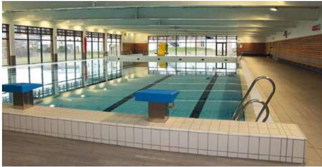
Au premier plan, le bassin de natation avec ses six lignes de nage

Elle est flambant neuve avec son bassin de natation et ses 6 lignes d'eau pouvant accueillir des compétitions, son petit bassin dont la profondeur ne dépasse pas 1,20 m, et sa fosse de plongée de 5 m de profondeur. La nouvelle piscine de La Mure, Aqua Mira, ouverte en août 2015, miroite toujours comme au premier jour! Le bâtiment s'étend sur 1600 m 2 de surface dans un parc de 1,5 hectare. « La piscine a été conçue pour répondre à une dimension sportive et à une dimension éducative. Savoir nager est une compétence indispensable, surtout ici, alors que nous sommes entourés de lacs de pleine nature », souligne Jean-Luc Thivend, directeur de l'Aqua Mira. Les activités proposées montent en puissance: Aqua