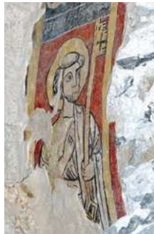
La visite guidée décalée vous emmènera à la découverte de détails du musée

Remontez le temps pendant le week-end du 26 et 27 mai. Le musée archéologique Grenoble Saint-Laurent lance une initiative sympathique à destination des familles: un week-end complet d'activités à vivre ensemble autour de l'archéologie. De multiples temps de partage sont conçus à cette occasion par la dynamique équipe du musée. Vous pourrez donc devenir enquêteur archéologue le temps de l'atelier « On est tombé sur un os ! », écouter des contes médiévaux