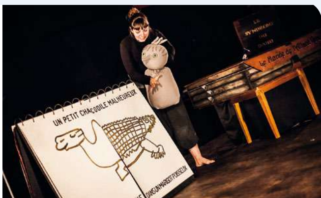
© La Fabrique des Petites Utopies

www.petitesutopies.com - 2 rue Dubois-Fontanelle à Grenoble - 0476 00 9152