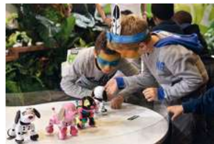
Les enfants testent de nouveaux jouets