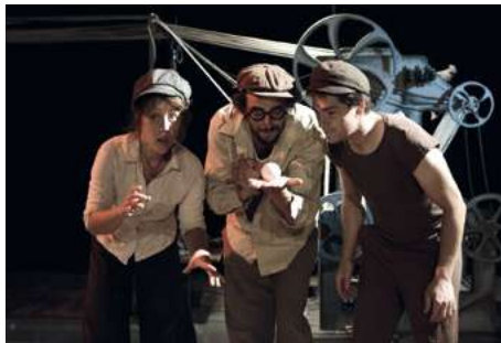
© C ies Solfasirc et Kbestan

Il est préférable de réserver : https://www.a-balles-et-bulles.fr/festival-les-turbulles-2018-cest-parti/