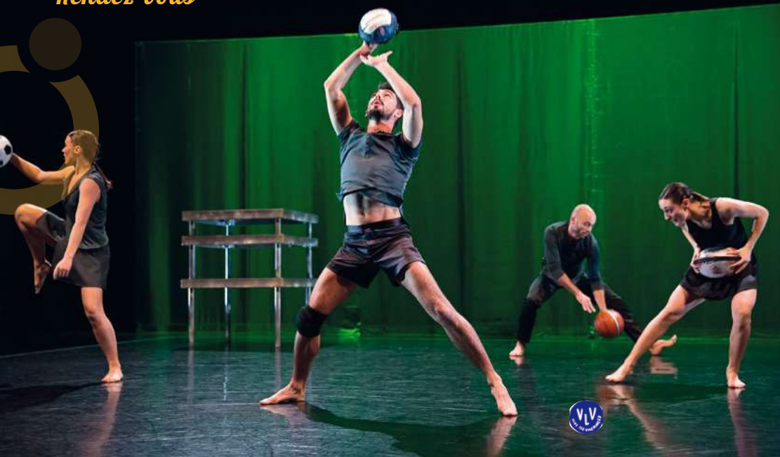
Rock & Goal à La Rampe mercredi 16 mai. Dès 5 ans. Les interprètes vous emmèneront du geste sportif au geste dansé.