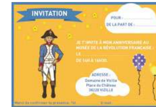
Un anniversaire au Domaine de Vizille

C'est nouveau ! Il est désormais possible de fêter son anniversaire au musée de la Révolution, dans le Domaine de Vizille. Les enfants, costumés comme il se doit, visiteront avec un guide le château. Ensuite, ils participeront à un atelier « Styliste au musée » où ils habilleront de petites figures en papier. Ils repartiront avec. Le goûter, préparé