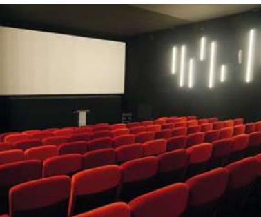
Des fauteuils neufs

www.voreppe.fr - place de 4€ à 6€ Le Cap, place Armand-Pugnot - Voreppe 04 76 50 02 09