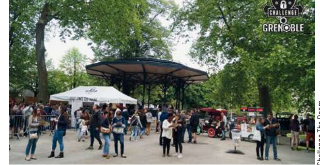
Les départs se font en continu toute la journée

Challenge the room lance une grande chasse au trésor gratuite dans Grenoble le 2 juin de 10h à 17h. Et comme les responsables de cette salle de jeux d'évasion (salles plus connues sous le nom d'Escape games) aiment les challenges, ils espèrent rassembler 10 000 participants pour cette troisième édition. La chasse au trésor est organisée avec trois niveaux de difficulté : starter, classic et ultimate. Les enfants de 7 à 12 ans s'inscrivent au niveau « Starter ». Ce sont eux qui jouent, accompagnés des parents. Le niveau « Classic » est ouvert aux familles avec des enfants