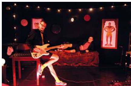
Homo Sapiens de la C ie Les Zinzins