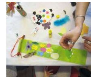
Pendant l'atelier de Pâques

Sophie. « Nous organisons 4 ateliers par an depuis 2014, continue-t-elle, à Pâques, en juin, en octobre et un autre pour Noël. Nous préparons nous-même de petits kits. L'enfant choisit celui qui lui plaît. Il n'a plus qu'à assembler. » Les petits kits sont vendus 1 ou 2€ et ensuite l'enfant bricole. Tout le monde peut participer, qu'il soit de Vaulnavey ou pas. L'argent récolté finance les sorties des assistantes maternelles. Elles envisagent d'acheter des jeux édu-