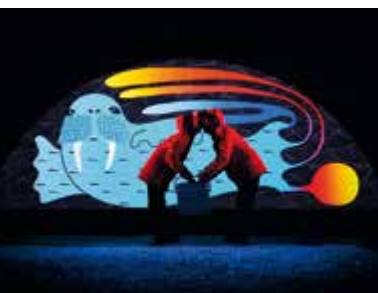
Illustrations de David Moreau