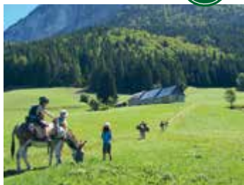
Cinq jours avec un âne aux Entremonts