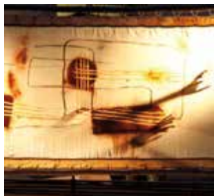
Tierra Efímera sera à l'espace Aragon le 26 février et au Coléo le 13 mars. Dès 4 ans

SORTIE RAQUETTES OU SKI DE FOND > En forêt de Chartreuse au clair de lune - tartiflette au retour - 19h - 25€ - location du matériel sur place - sur réservation - La Ruche à gîter - Saint-Christophe-sur-Guiers - 0476 06 38 21