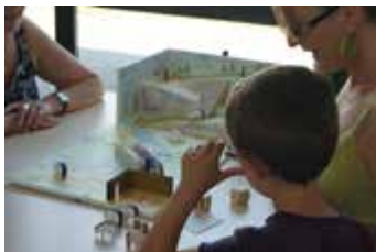
Prendre le temps de jouer ensemble

Drôles de beaux jeux - 04 76 93 26 48 - http://www.drolesdebeauxjeux.fr - 06 85 30 28 75