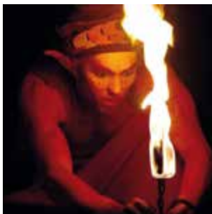
L'Elfe de feu, à Oz-en-Oisans le 16 février. La station propose des spectacles jeune public en février.

JOURNÉE DES ENFANTS > Spectacle familial conté par la C ie Nathalie