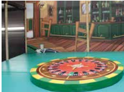
Tours de folie sur la Magic Wheel

En effet, les trois salles sont décorées chacune dans une thématique différente. L'effet est très réussi. Le snack aussi aura des saveurs d'outre-atlantique puisque des hot-dogs américains y seront servis.