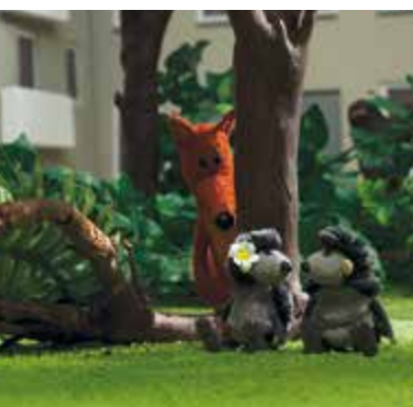
Les Espiègles: sortie nationale de ce film de 4 courts-métrages le 10 février

T u viens! Ce duo clownesque de jongleurs, joué le 16 février à Villard-Bonnot est comme une invitation du festival "Grandes