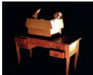
Au Bonheur des Vivants à La Vence Scène le 6 février. Dès 8 ans.

ATELIER CRÉATIF ➤ Tampon batata découverte du travail d'un tamponneur du souk des tissus à Damas. Les enfants décoreront des tissus avec