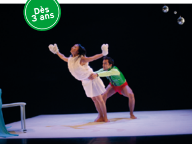
Lune et Colorin : la rencontre