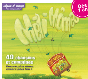
Illustration de la jaquette par Carine Sanson

« E ncore plus doux, encore plus fou ». C'est ainsi que les musiciens des Méli-Mômes décrivent leur deuxième CD 40 chansons et comptines - volume II sorti le 20 octobre dernier, dix-huit mois après le premier volume. Il y a comme un sentiment de jubilation douce à écouter tous ces titres de l'enfance, certains connus comme L'empereur, sa femme et le petit prince ou J'aime la galette , et d'autres moins renommés comme Écureuils des bois , Belle lune blanche ou Ani Couni . L'explication: « Nous avons réfléchi longuement aux arrangements, écoutant chaque titre pour créer l'univers musical qui conviendrait le mieux, écrivant même parfois