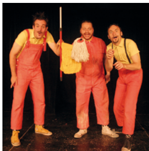
Du théâtre burlesque à La Faiencerie avec Wow! (dès 5 ans) le 22 janvier

DANSE THÉÂTRE ET VIDÉO > Dot C ie Maduixa théâtre - Espace Aragon - Villard-Bonnot - 18h30 - 7 à 12€ - dès 4 ans - 45 min - 04 76 71 22 51