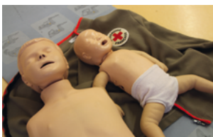
Des « bébés » mannequins pour s'exercer

Prochaines dates : les samedis 19 décembre, 9 janvier, 13 février et 12 mars - de 8h30 à 12h30 - 35€/4 heures