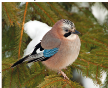
Un geai des chênes

Grenoble-Alpes Métropole s'associe avec la FRAPNA Isère (fédération Rhône-Alpes de protection de la nature) pour organiser des sorties « Nature » dans l'agglomération. Bonne nouvelle: grâce au soutien de la Métro, ces sorties sont entièrement gratuites. Elles sont accessibles en famille avec des enfants dès 9 ou 10 ans (bien se renseigner lors de l'inscription, qui est obligatoire).