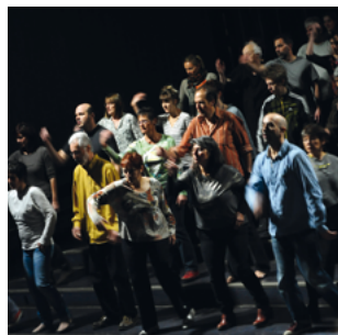
Interprètes amateurs et professionnels se mélangent

Espace 600 - Grenoble - 0476 29 42 82 - www.espace600.fr