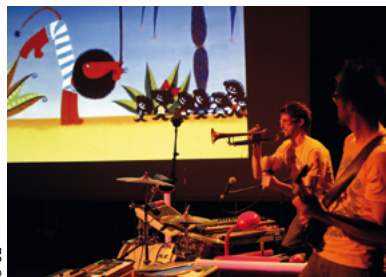
Le ciné-concert Le voyage du Lion Boniface . Le 28 nov. à l'Espace 600, le 21 déc. à Eybens et le 27 janvier à Saint-Égrève. Dès 2/3 ans.

ATELIER > Crée et décore ton sapin de Noël par Cécile Drevon, illustratrice - 15h30 - de 4 à 6 ans - 7€ - 1h30 - Musée de Bourgoin-Jallieu - 04 74 28 19 74