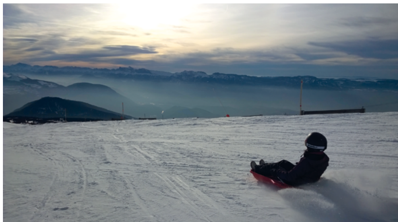
Chamrousse créé une nouvelle piste de luge (dès 6 ans)

De nouvelles pistes de luge, de ski, des initiations au curling, un village d'igloos ... Découvrez les nouveautés de cette saison d'hiver.