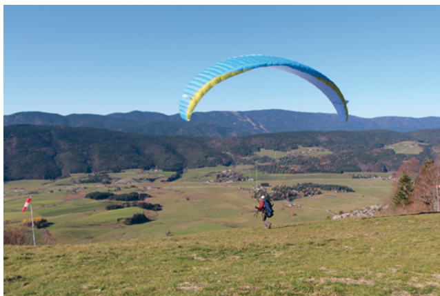
Départ de parapente sur la zone d'envol au Clos de Lans

Sur les hauteurs de Lans-en-Vercors, cette balade traverse le bucolique plateau des Allières, en serpentant dans la forêt et offre un joli panorama sur le Val de Lans. Cette promenade est accessible toute l'année car le sentier est balisé pour les raquettes l'hiver.