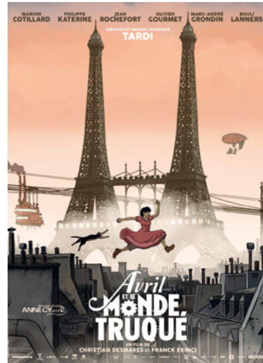
Avril et le monde truqué de Jacques Tardi

Avec ces deux salles, le festival est voué à prendre de l'ampleur. Près de 35 films ont été sélectionnés et seront proposés au public au cours d'une cinquantaine de projections. L'office du tourisme, la mairie, et l'association Le Clap, organisateurs de la manifestation, ont choisi comme thème : Du livre au film. Le festival mettra en avant certaines œuvres ainsi passées de l'écrit à l'écran comme Le Petit Prince sorti cet été, inspiré du texte d'Antoine de Saint-Exupéry. Les autres choix se sont portés sur Au cœur de l'Océan (librement inspiré du roman fantastique d'Herman Melville, Moby Dick ), Avril et le monde truqué , dont le graphisme est réalisé par l'auteur et dessinateur de bande dessinée Jacques Tardi ; Le salsifis du Bengale et autres poèmes de Robert Desnos, film d'animation directement inspiré du poète. Le ciné-lecture-concert L'Homme qui plantait les arbres , adapté de la