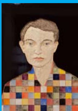
Relief. Homme à la chemise aux carreaux multicolores (2010) de Stephan Balkenhol, en bois peint.

Musée de Grenoble. : 04 76 63 44 47 - réservation pour les contes : 04 76 63 44 44