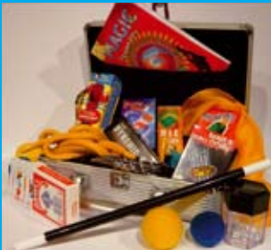
Du matériel de professionnel

La magie est entourée de mystère et de secret. Pour entrer dans le clan des "vrais" magiciens, il faut connaître des trucs et des tours, et utiliser des accessoires. Pour concilier ces deux impératifs, le magasin grenoblois Magic Events propose comme cadeau de Noël une mallette de magicien accompagnée d'une heure - ou deux - de cours de magie. Les enfants apprendront ainsi à mettre en scène les tours contenus dans la mallette.