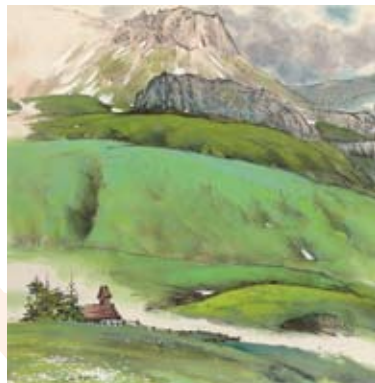
Le col du Lautaret peint par He Yifu. Remarquez sur la droite le sceau rouge et la petite calligraphie noire, deux signatures caractéristiques de la peinture chinoise

➤ He Yifu, le voyage d'un peintre chinois dans les Alpes - musée de l'Ancien Évêché - Grenoble - jusqu'au 28 février 2011 - gratuit - 04 76 03 15 25