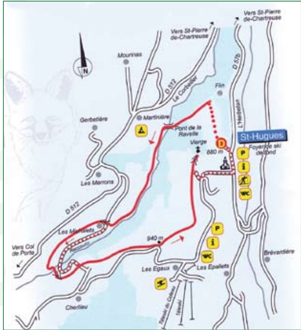
Carte disponible à l'office du tourisme de Saint-Pierre de Chartreuse.

de Saint-Hugues de Chartreuse. Prenez le petit morceau de route goudronnée qui longe le cimetière et prolongez votre marche à travers champs en longeant la colline. Vous arrivez sur le premier poteau indicateur jaune "Flin" (880 m d'altitude). Prenez le sentier qui descend dans la forêt. Vous atteignez la rivière et passez sur le pont qui enjambe la Ravelle. Tournez tout de suite à gauche, en passant sur les planches en bois qui traversent un petit ru. Le sentier court tranquillement dans les prés en longeant la rivière (qui est sur votre gauche). Vous atteignez quelques maisons et reprenez la route goudronnée. Ensuite, vous accédez à une scierie et traversez à nouveau la rivière. Le sentier tourne légèrement vers la gauche et entame une petite montée. En haut de celle-ci, la route goudronnée part sur la droite. Vous la laissez pour