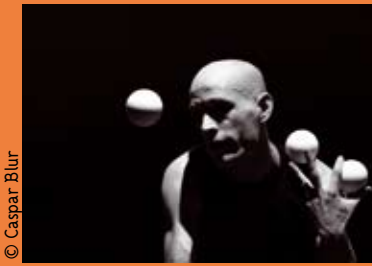
Stefan Sing, danseur et jongleur

► Panorama des jonglages/ création - Hexagone à Meylan - 10 déc. à 20h et 11 déc. à 20h - dès 6 ans - 9,5/21€ - 04 76 90 00 45