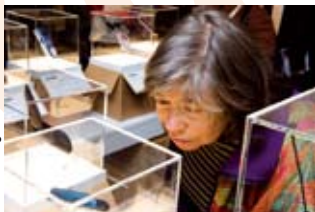
Un œil attentif sur l'évolution des téléphones portables

D écouvrir l'imprimante 3D, les logiciels de reconnaissance faciale ou observer un drone ... l'exposition "Tous connectés ? Enquête sur les nouvelles pratiques numériques" présentée à la Casemate à Grenoble permet d'approcher cette "mystérieuse" technologie numérique. Aujourd'hui, ces applications sont dans notre quotidien, sans même parfois que nous le sachions. L'exposition présente de façon précise et très documen-