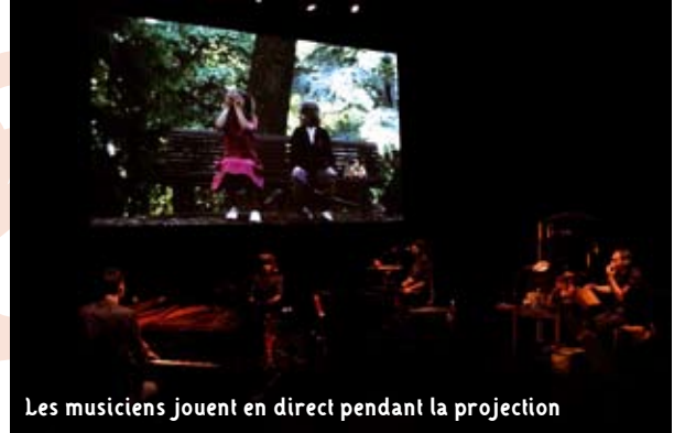
Les musiciens jouent en direct pendant la projection

"Frankenstein ou le Prométhée moderne", la compagnie rhônalpine La Cordonnerie a choisi de "s'attaquer à l'un des mythes modernes les plus fascinants". Elle a cependant choisi de donner au spectacle une atmosphère plus poétique que les œuvres originales. Néanmoins les thèmes abordés se rejoignent : ombres et lumières, science et conscience, apparence et préjugés. Au décès de ses parents, Victor Frankenstein reste cloîtré dans la maison familiale et se met à travailler sur des expériences de vie au delà de la mort... Dans son laboratoire, il a déjà réussi à redonner vie à des grenouilles et attend de pouvoir poursuivre avec des êtres